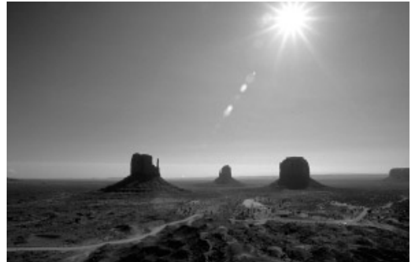
Der Klassiker : West Mitten-, Merrick- und East Mitten Butte (v. links)

Ein cinemascope-weites Tal, drei mächtige rote Sandsteintürme, darüber ein unendlich blauer Himmel. Was braucht es mehr zu einer Filmkulisse, zu einem prächtigen Bild, zu einem Ort der Sehnsüchte und Wünsche? Aber Monument Valley besteht nicht nur aus Träumen, sondern hat auch eine reale Seite: es ist ein Stammespark, von den Navajos verwaltet, deren Mitglieder noch immer im Tal von der Schaf- und Ziegenzucht leben.