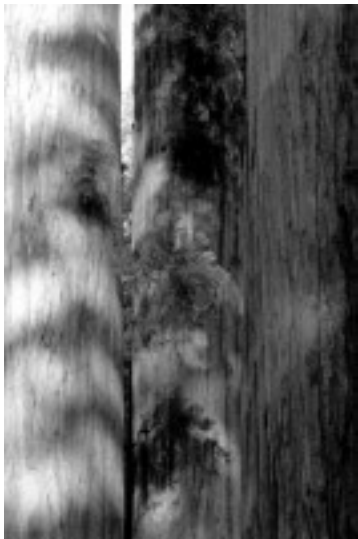
schöne 3er Gruppe, wer ist die Dame ?

Übernachten können Sie in Sequoia auf sieben Campingplätzen (vier davon bieten auch Stellplätze für Wohnmobile) oder in den weichen Betten zweier Lodges. Kings Canyon bietet ebenfalls sieben Campingplätze (alle mit Stellplätzen für Wohnmobile) und zwei Lodges. Die Saison dauert in beiden Parks üblicherweise von Mitte Mai bis Ende September. Während des Winters erreichen Sie über die Rt-180 von Westen aus nur Grand Grove - und Lodgepole Village, der weitere Verlauf hinunter in den Kings Canyon ist dann gesperrt. Kraftstoff bekommen Sie im privaten Silver City Resort