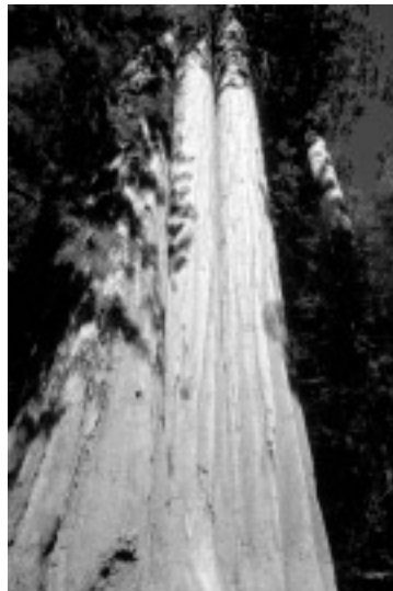
Schiere Größe : Mammutbäume

Eine Nacht sollten Sie schon entlang des Generals Highways im Sequoia National Park verbringen, um ein wirkliches Gefühl für die Stille in der Mitte dieser Mammutbäume zu bekommen. Eine weitere Nacht in der Tiefe des Kings Canyon sollte auch das Verständnis dieser Landschaft fördern.