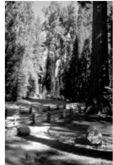
Grant Grove : Parade der Giganten

Die Sequoias und Redwoods sind aufgrund ihrer Höhe nur schwer unverzerrt aufzunehmen. Um dies zu erreichen, müssen Sie sich als Kleinbildphotograph also entsprechend weit vom Motiv entfernen oder ein aus der Architekturphotographie bekanntes Shift Objektiv verwenden. Letzteres gleicht die stürzenden Linien bei einer aus der waagerechten verschobenen Kamera zum großen Teil wieder aus. Zum